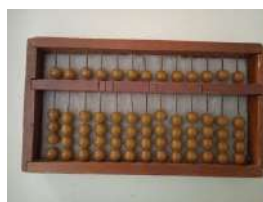
Figura 3. Stchoty, el ábaco ruso.

Lo anterior constituye una visión superior a la forma tradicional de atender a los educandos ciegos, al concebirse el uso del ábaco en función de la atención de las dificultades que presentan estos, tanto desde el punto de vista psicológico, como del contenido del cálculo aritmético.